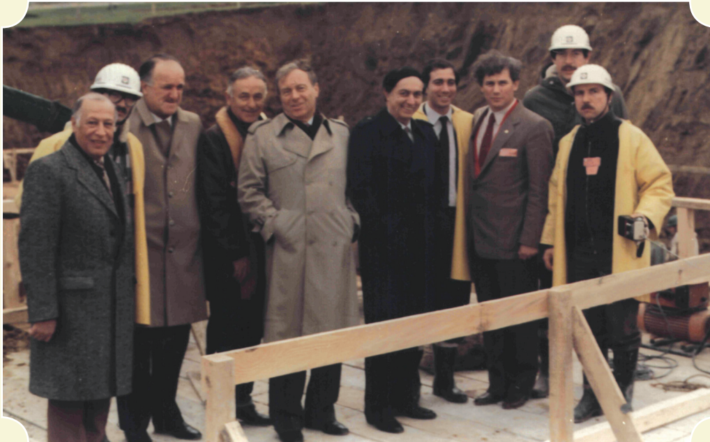
Alkent Etiler - 1985