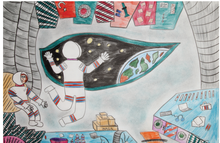
Mansiyon – Ezgi Yapıcı - İstanbul